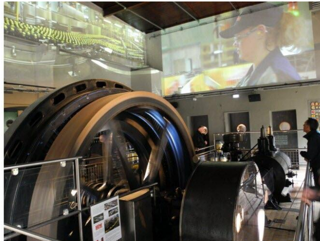
La Villa Meteor, qui permet de découvrir les procédés de fabrication de la bière, accueille 20 000 visiteurs par an.

L'Alsace : ses vins, ses châteaux forts, ses marchés de Noël... et ses bières ! Terre de brasseries – on en compte tout de même une bonne centaine, toutes tailles confondues –, l'Alsace n'est encore que trop peu identifiée comme une destination de tourisme brassicole. Il y a là pourtant un levier non négligeable de développement et de notoriété, tant pour les professionnels que pour le territoire. Les brasseurs y songent depuis quelques années et le dossier a officiellement été mis sur la table l'année dernière lors d'un premier forum baptisé « Alsace terre brassicole » réunissant les acteurs de la filière. Sa deuxième édition, organisée ce mardi au Palais de la musique et des congrès de Strasbourg par les Brasseurs d'Alsace et Alsace destination tourisme (ADT), visait à « poursuivre la dynamique ». En s'inspirant notamment d'initiatives existantes, à commencer par celles des vignerons, pionniers en la matière.